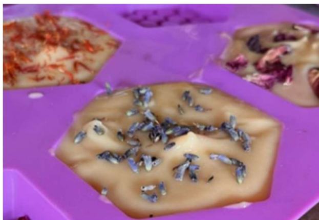
Gambar 3. Hasil Kreasi Sabun Madu

Pendidikan berbasis keterampilan kreatif dapat menjadi fondasi penting bagi pembentukan entrepreneurial mindset sejak dini, karena menumbuhkan rasa ingin tahu, inovasi, dan keberanian untuk mencoba hal baru (Arta dkk., 2023). Dalam konteks diaspora Indonesia di Malaysia, kemampuan menciptakan produk kreatif berbahan alami seperti sabun madu dapat menjadi alternatif sumber pendapatan sekaligus media ekspresi budaya lokal.