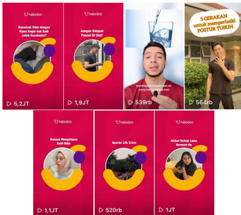
Figure 3. Konten video: 7 konten