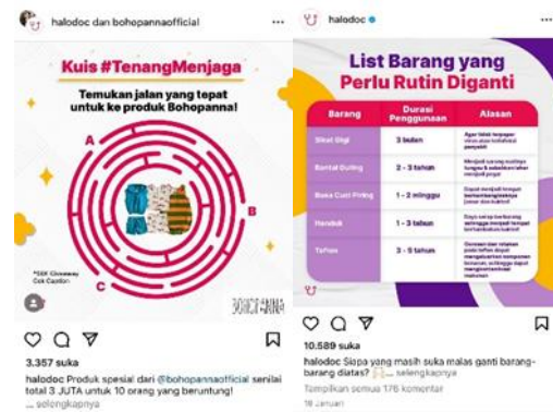
Figure 1. Konten gambar tunggal: 2 konten